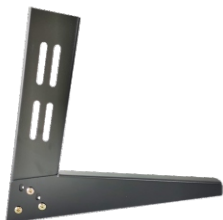
3.底座板和立柱用螺丝固定 (M5)