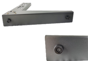
6.底座板下可选装减震胶