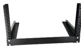
5.1U封板固定后机架成型