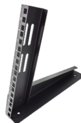
2. 底座板和立柱对面 (注意底座板和立柱有左右之分)