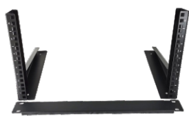
4.左右架固定后, 1U封板安装在1U位